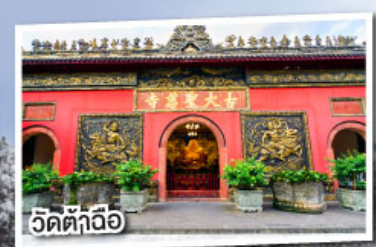
วัดต้ากั๋วอ๋อ