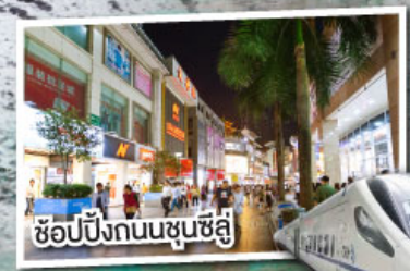
ช้อปปิ้งถนนชุนซีลู่