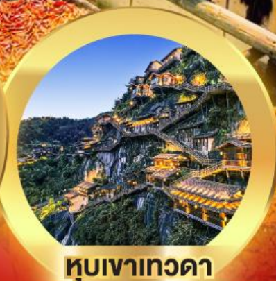
หุบเขาเทวดา