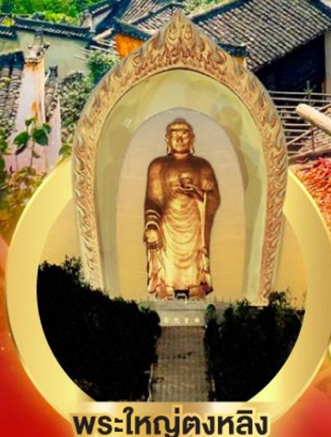
พระใหญ่ตงหลิง