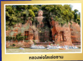
หลวงฟ่อโตเล่อซาน