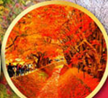
อุโมงค์ใบเมเปิ้ล โมมิจิ ไคโร