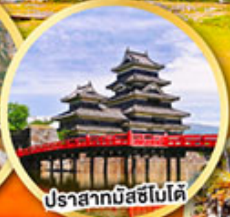
ปราสาทมัสชิโมโด้