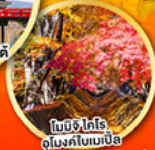
โมมิจิ โคโร อุโมงค์ใบเมเปิ้ล

เที่ยวเต็มทุกวัน ไม่มีฟรีคีย์ พักออนเซ็น 2 คืน พักโตเกียว 1 คืน บินเจ้านาโกย่า-ออกโตเกียว