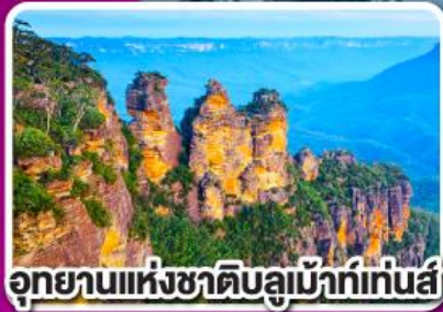
อุทยานแห่งชาติบลูเมาท์เทนส์