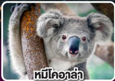
หมีโคอาล่า