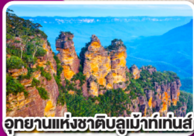
อุทยานแห่งชาติบลูเมาท์เทนส์

พิเศษ เมนูกึ่งลิอบส์เตอร์ทำนละ 1 ตัว พร้อมไวน์ชั้นเยี่ยม