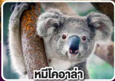
หมีโคอาล่า