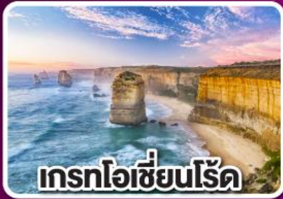
เกรทโอเซียนโรด