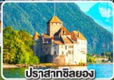
ปราสาทซิลยอง