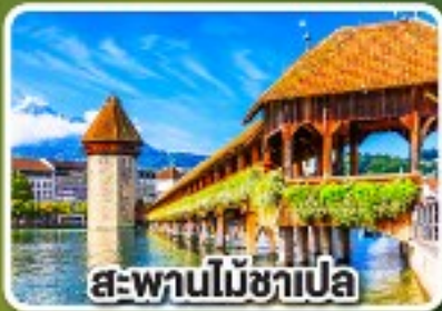
สะพานไมซ์าเปล