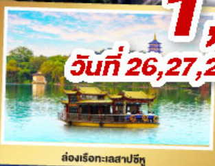
เรือชาป๋อ