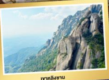
เขาหลิงซาน