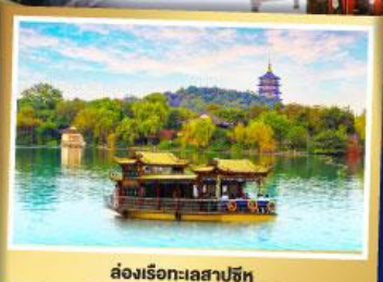
ล่องเรือชมวิวกะเลสาปซีหู