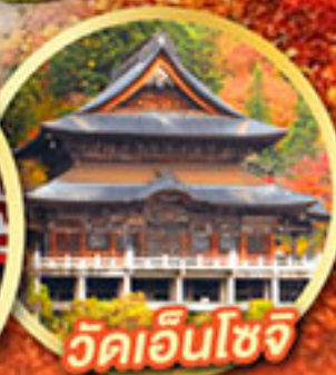
วัดเอ็นโซจิ

กิจกรรมเก็บผลไม้ พักออนเซ็น 2 คืน พักโรงแรมในโตเกียว 2 คืน