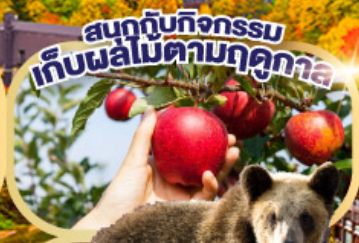
สนุกกับกิจกรรม เก็บผลไม้ตามฤดูกาล