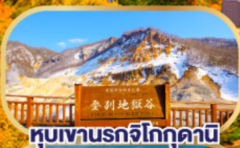
หุบเขานรกโจโกดามิ

นั่งกระเช้าชมวิวฮาโกดาเตะ (รวมค่ากระเช้า)