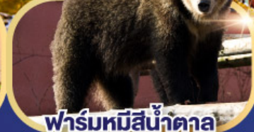
ฟาร์มหมีสึ่น้ำตาล