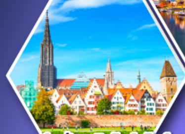
อูล์มบ้านเกิดไอน์สไตน์