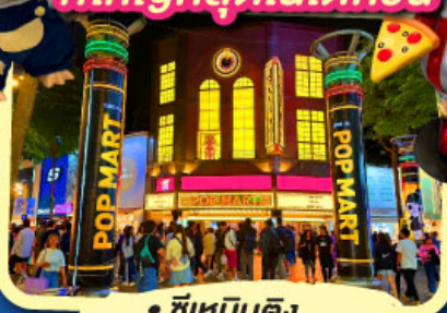
• ซีเหมินดิง