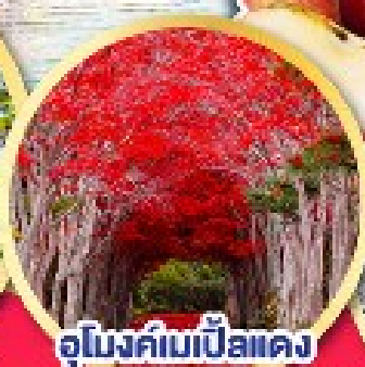
อุโมงค์เมเปิ้ลแดง ณ สวนลับฮิราโอเกะ