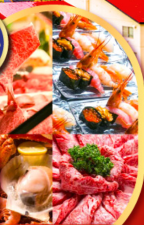
พิเศษ!! บุฟเฟ่ต์ร้าน NANDA ดีที่สุดในชิปปังโระ