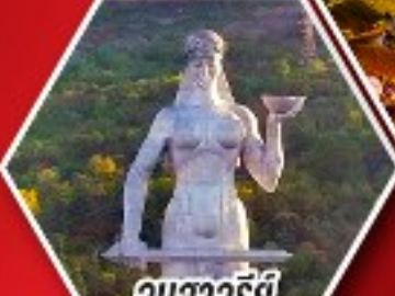
อนุสาวรีย์