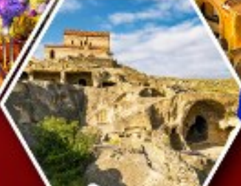
เมืองดำอพิลิสตีเคห์

แพ็คเกจ Rooms Hotel โรงแรมวิวทิวทัศน์ของเทือกเขาคอเคซัส