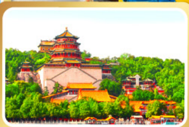
พระราชวังฤดูร้อนอ้อเหอหยวน