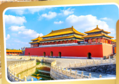
พระราชวังโบราณปักกิ่ง