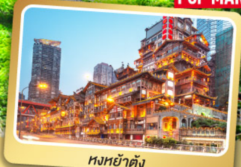
หงหย่าต้ง