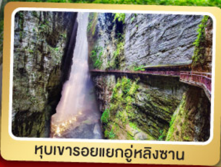
หุบเขารอยแยกอู่หลิงซาน