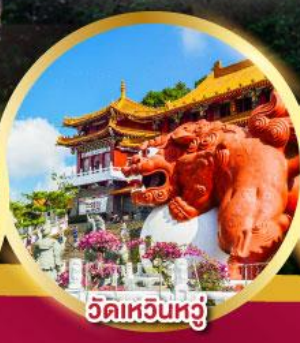
วัดเหวินหวั่น