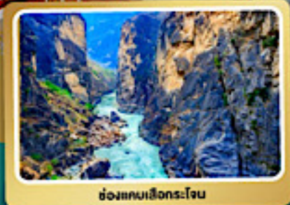
ช่องแคบเสิงกระโจน