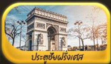
ประตูชัยฝรั่งเศส

พิเศษ!! ล่องเรือแม่น้ำแซนชมเมือง โดย บาโด บูช