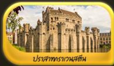
ปราสาทราเวนสตีน