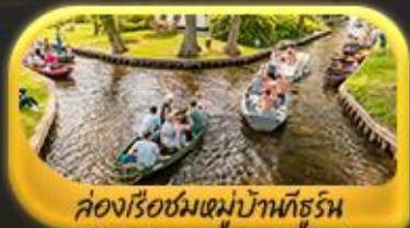
ล่องเรือชมหมู่บ้านชัวร์ิน