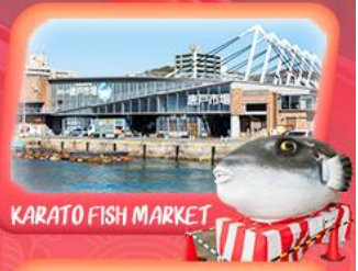
KARATO FISH MARKET

vietjetair.com สายการบิน Vietjet Air (VZ) น้ำหนักกระเป๋า 20 KG