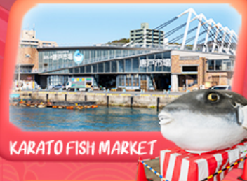
KARATO FISH MARKET

✈ สายการบิน Vietjet Air (VZ) vietjetair.com น้ำหนักกระเป๋า 20 KG