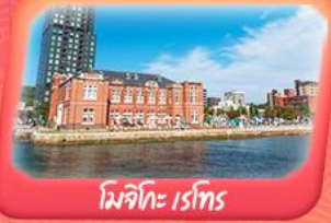
มิซึทึะ เรโทริส

สัมผัสกลิ่นอายญี่ปุ่นแท้ไปบูโห้บึง... ศาลเจ้าคาไซฟู จอพรวัดคัง วัดนินโซอิน บุนถ่ายรูปสวย! หมู่บ้านยูฟูอินสุดน่ารัก ชมวิวทะเลสาบกินริน ย้อนอดีตกับ โมจิโกะ เรโทริส เปิดประสบการณ์นั่งเรือเฟอร์รี่ เช็คอินตลาดปลาอาราโตะ ซ้อมบั้งจุกี้ อาทานิเคคิเค-คิวยู และ Lalaport Fukuoka