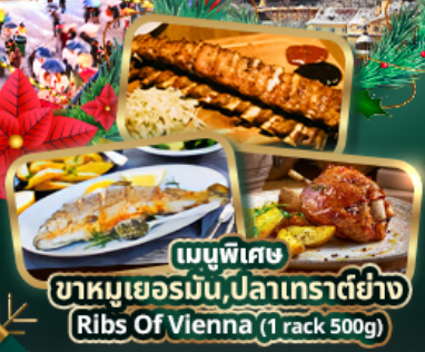
เมนูพิเศษ ขาหมูเยอรมัน, ปลาเทราต์ย่าง Ribs Of Vienna (1 rack 500g)