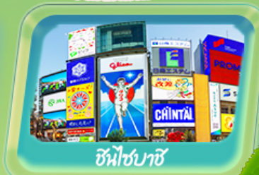
ชินโซบะชิ