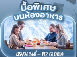
มือพิเศษ บนห้องอาหาร