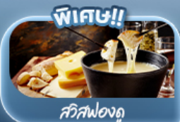
สวิสฟองดู