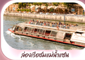
ล่องเรือชมแม่น้ำแซน