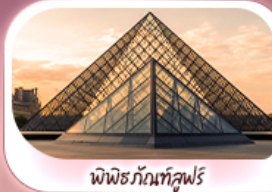
พิพิธภัณฑ์ลูฟร์