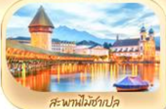
สะพานไมซ์าเปค