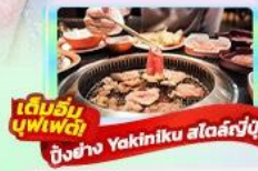
เดินชมบุฟเฟ่ต์ ปิ้งย่าง Yakiniku สไตล์ญี่ปุ่น

22-26 พ.ค. 69 / 29 พ.ค.-02 มิ.ย. 69 17-21 มิ.ย. 69 / 26-30 มิ.ย. 69