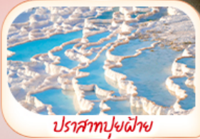
ปราสาทฟูยี