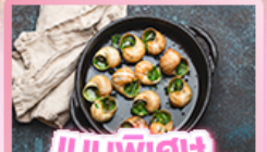
เมนูพิเศษ หอยเอสคาโกต์

เยอรมัน เนเธอร์แลนด์ เบลเยียม ฝรั่งเศส Keukenhof