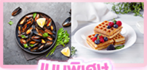
เมนูพิเศษ หอยมัสเซล+วาฟเฟิล