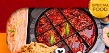
มือพิเศษ สุกี้หม่าล่า