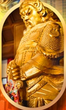
ทองรูปหล่อ