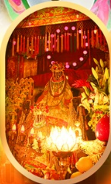
เจ้าแม่กวนอิมทองคำ