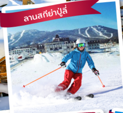
ลานสกียาปูลี่