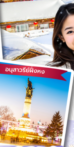
อนุสาวรีย์ผึ้งหง