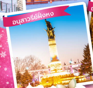
อนุสาวรีย์ฟิ่งทง