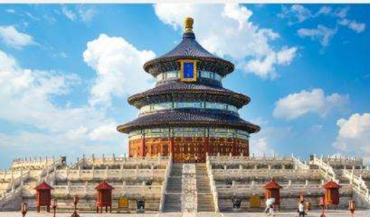
หอบูชาฟ้าเทียนถาน