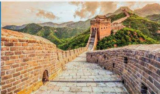
กำแพงเมืองจีน