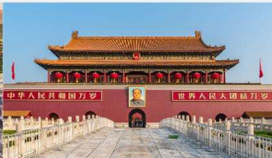
จัตุรัสเทียนอันเหมิน