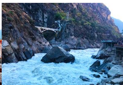
ช่องแคบเสื่อกระโถน