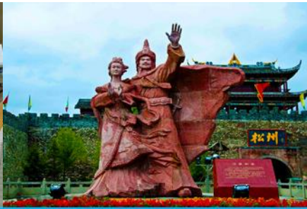
เมืองโบราณซงพาน