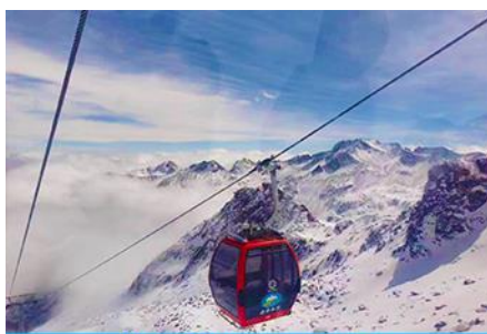
นั่งกระเช้าสู่อุทยานสวรรค์ ภูผาหิมะการ์เซียต้ากู่

พักที่ YARI INTER HOTEL 4* หรือ โรงแรมระดับเดียวกันท้องถิ่น