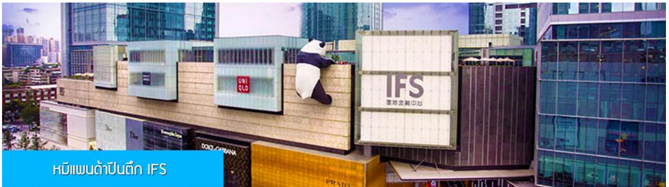
หมีแพนด้าปีนตึก IFS