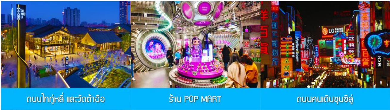
ถนนไท่กุ่หลี่ และวัดต้าฉือ