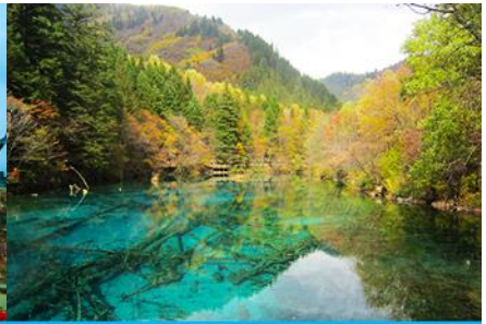
อุทยานจิวจ้ายโกว