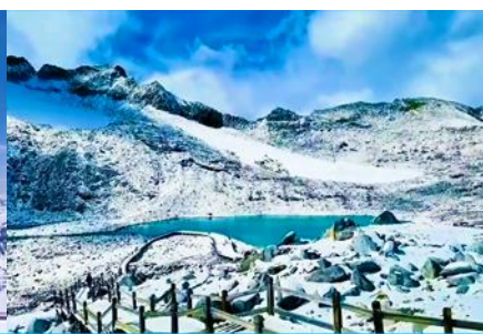
ทะเลสาบต้ากู่

วันที่ 1 เมืองเหอตู๋-อุทยานภูเขาคาร์เซียต้ากู่ปิงชว่น (รวมค่ากระเช้าขึ้น-ลง) - รถเมลล์ในอุทยาน- เหอตู๋