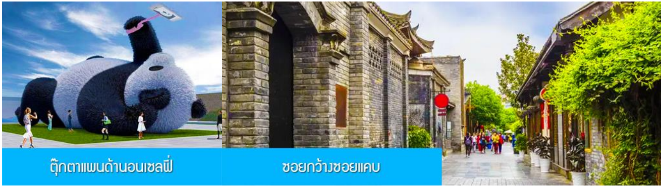
ตุ๊กตาแพนด้าอนเซลฟี

พักที่ DAGU GLACIER HOTEL 4* หรือ โรงแรมระดับเดียวกันพื้นเมือง