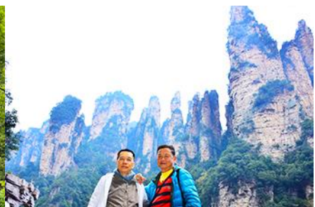
ชมจุดชมวิวลีฟกัแก้ว