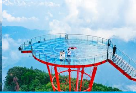
ระเบียงชมวิว Sky Eye