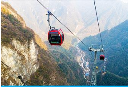
กระเช้าขึ้น/ลงเขาเจ็ดดาว