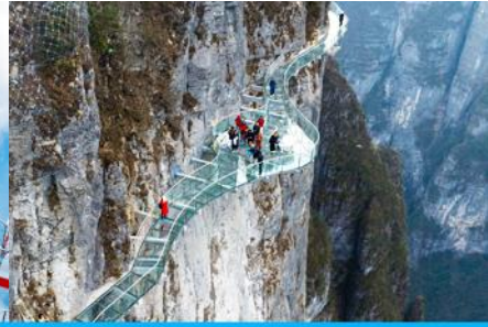
ระเบียงทางเดินเลียบบหน้าผา

วันที่สาม จางเจียเจีย-ศูนย์สมุนไพรจีน-ผลิตภัณฑ์ยางพารา- กระเช้าขึ้น/ลงเขาเจ็ดดาว – ระเบียงชมวิว Sky Eye - ระเบียงทางเดินเลียบบหน้าผา – (เลือกซื้อโปรแกรมเสริม โห้วจิ้งจอกขาว)