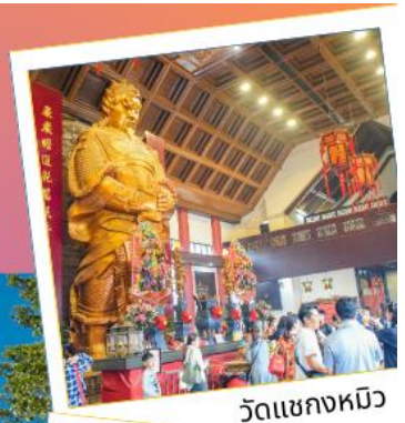
วัดเข่งหมิว