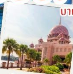
มัสยิดบุตรา