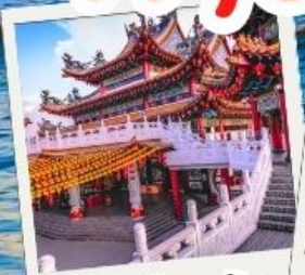
วัดเทียนหัว