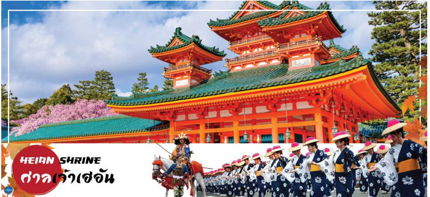
HEIAN SHRINE ศาลเจ้าเฮอัน

เช้า รับประทานอาหารเช้า ณ ห้องอาหารของโรงแรม (6)