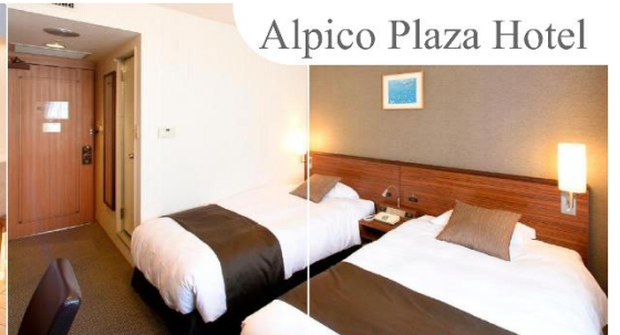
Alpico Plaza Hotel