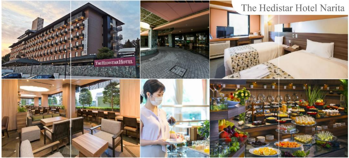
The Hedistar Hotel Narita

THE HEDISTAR HOTEL NARITA หรือระดับเดียวกัน