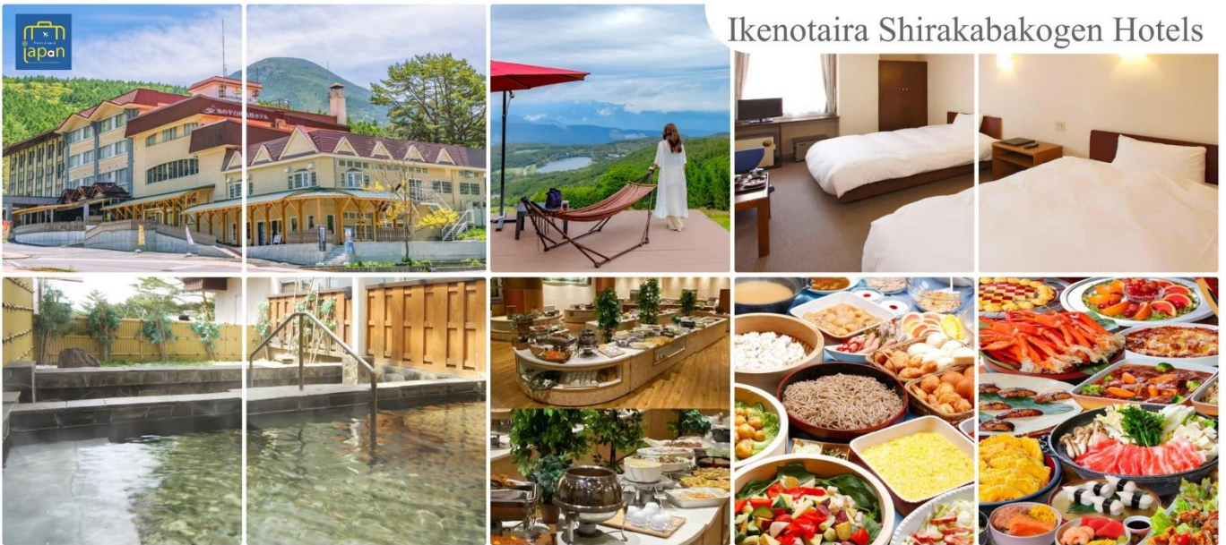
Ikenotaira Shirakabakogen Hotels

หลังอาหารให้ท่านได้ผ่อนคลายกับการแช่น้ำแร่ธรรมชาติ เชื่อว่าถ้าได้แช่น้ำแร่แล้ว จะทำให้ ผิวพรรณสวยงามและช่วยให้ระบบหมุนเวียนโลหิตดีขึ้น