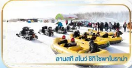
ลานสกี สโนว์ ฮักโซฟาโนราฆ่า