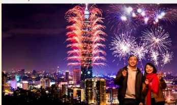
COUNTDOWN TO 2025