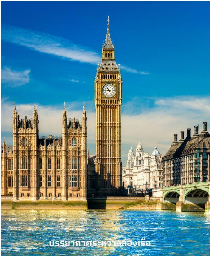
บรรยากาศระหว่างล่องเรือ

จากนั้นนำท่านผ่านชม พระราชวังบักกิงแฮม ก่อนนำท่านเก็บภาพสวยๆที่ หอนาฬิกาบิ๊กเบน สัญลักษณ์ที่สำคัญของลอนดอนที่ตั้งอยู่เคียงข้างอาคารรัฐสภาที่สวยงามริมฝั่งแม่น้ำเทมส์ จากนั้นผ่านชมสถานที่สำคัญต่างๆ อาทิ บ้านเลขที่ 10, ถนนดาวนิงนี้่่งทำเนียบนายกรัฐมนตรี, จัตุรัสทราฟัลการ์, อนุสรณ์แห่งสงครามทรافلการ์ของท่านลอร์ดแนลสัน, พิคคาเดิลลี เซอร์คัส, ย่านโซโฮ ฯลฯ