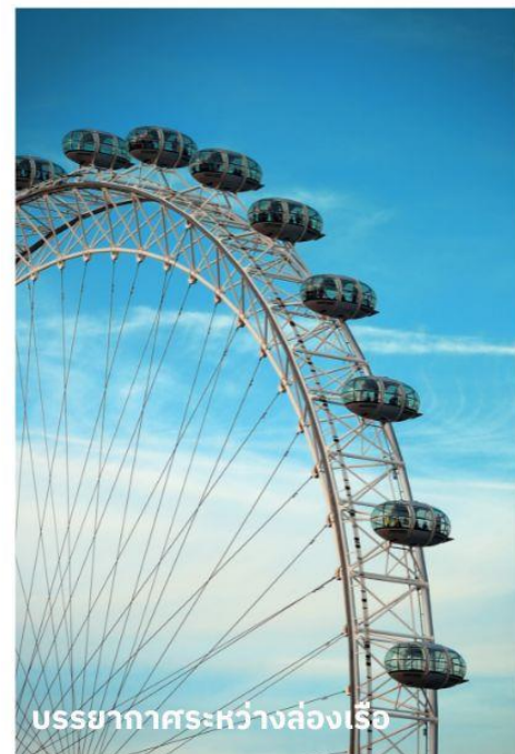
บรรยากาศระหว่างล่องเรือ

ท่านสามารถทำการสแกน QR CODE นี้ เพื่อรับชม “บรรยากาศของ Big Ben” ในรูปแบบวิดีโอ