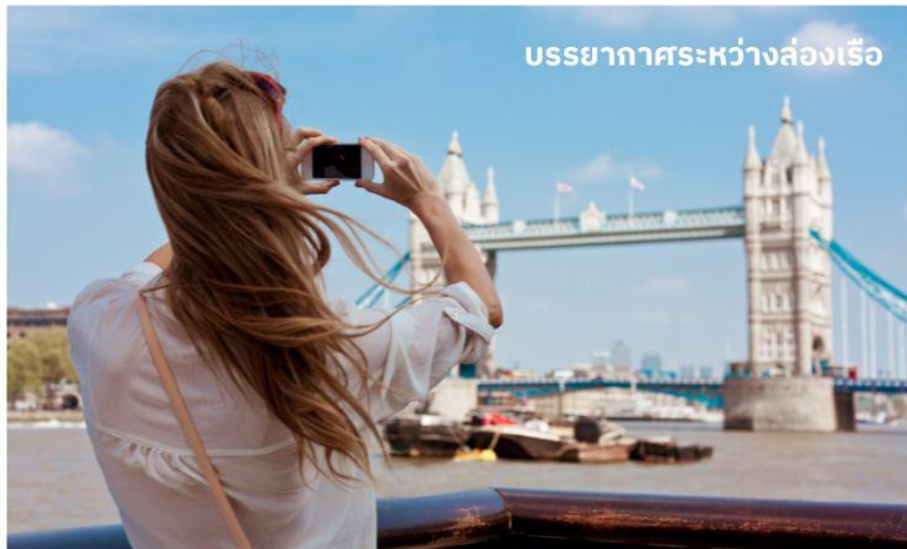
บรรยากาศระหว่างล่องเรือ

ชมทิวทัศน์งดงามของสองฝากฝั่งแม่น้ำเทมส์ ซึ่งไหลผ่านกลางกรุงลอนดอน ล่องเรือผ่านสถานที่สำคัญต่างๆ เช่น จัตุรัสรัฐสภา, พระราชวังเวสต์มินสเตอร์, ลอนดอนอาย, ทาวเวอร์ออฟลอนดอน และ ทาวเวอร์บริดจ์