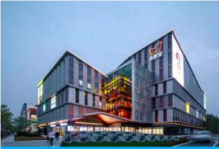
ตลาดเกาหลีเจี๊ว