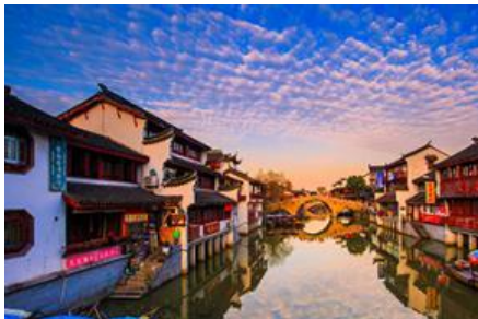
เมืองโบราณ ซิเป่า

ค่ำ รับประทานอาหารค่ำ ณ ภัตตาคาร พักที่ โรงแรม Luna Garden Hotel or Holiday Inn Express Hotel 4* หรือเทียบเท่าในเมืองเชียงใหม่