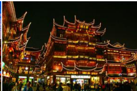
ย่านฉางหวงเมี่ยว