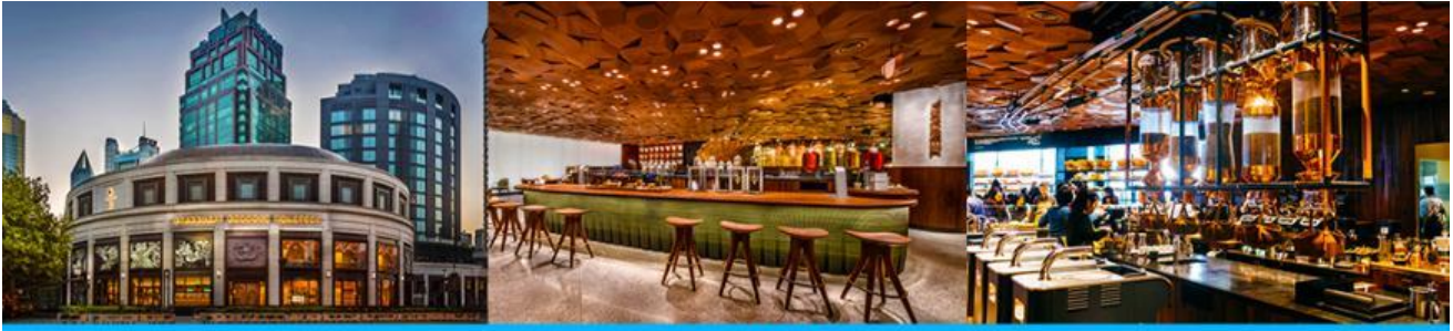
สตาร์บัคใหญ่ที่สุดในโลก