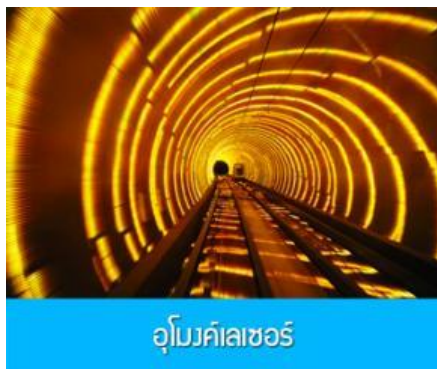
อุโมงค์เลเซอร์