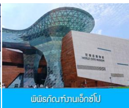
พิพิธภัณฑ์งานเอ็กซ์โป