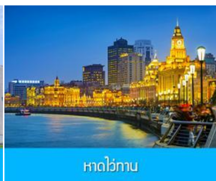
หาดไว่ทาน

วันที่สาม นครเซี่ยงไฮ้ – ย่านเทมส์ทาวน์ – พิพิธภัณฑ์งานเอ็กซ์โป – หาดไว่ทาน – อุโมงค์เลเซอร์ – หอไข่มุก – ช้อปปิ้งถนนคนเดินนานจิงฉู่ - ร้าน POP MART เซี่ยงไฮ้