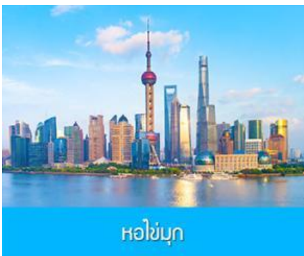
หอไข่มุก