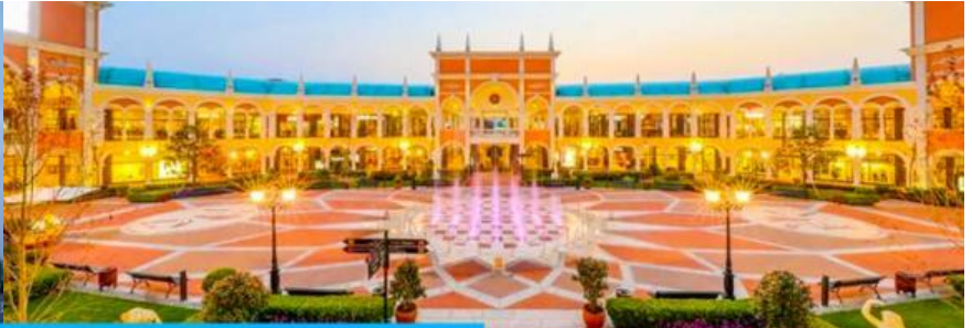
Florentia Village Outlet