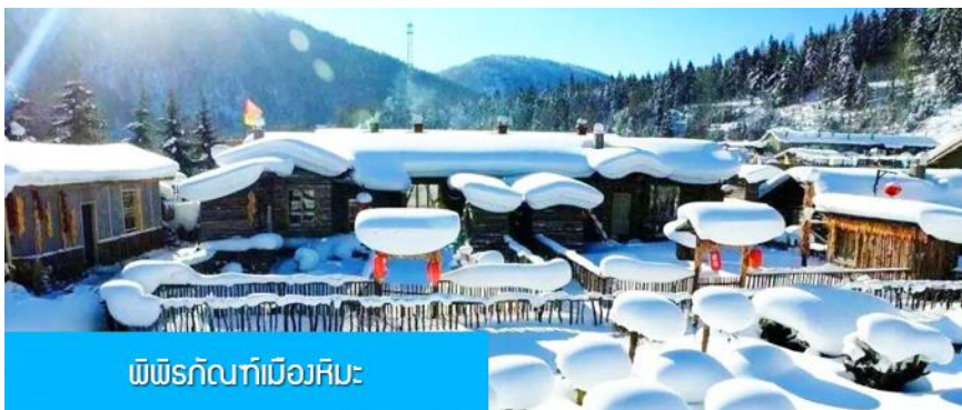
พิพิธภัณฑ์เมืองหิมะ

หมายเหตุ การไปพักในเมืองหิมะทางทัวร์ไม่สามารถจัดรถทัวร์ไปส่งรถทัวร์ถึงหน้าโฮมสเตย์ได้ ทางคณะต้องนั่งรถเมล์หมู่บ้านเข้าไป โดยรถทัวร์ต้องถือหรือลากกระเป๋าเข้าที่พักด้วยตัวเอง เพราะโฮมสเตย์จะไม่มีพนักงานยกกระเป๋า มาคอยบริการยกกระเป๋าให้ผู้เข้าพัก ท่านควรจัดเตรียมกระเป๋าใบเล็กที่บรรจุเสื้อผ้า และเครื่องใช้จำเป็นสำหรับการพักแรม ณ โฮมสเตย์ในเมืองหิมะในคืนนี้ เพื่อสะดวกต่อการเคลื่อนย้ายกระเป๋า, และภายในห้องพักจะไม่มีผ้าเช็ดตัวผืนใหญ่ จะมีเพียงสบู่ แชมพูบริการทุกโรงแรม ท่านควรเตรียมแปรงสีฟันยาสีฟันติดไปด้วย