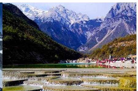
หุบเขาพระจันทร์สีน้ำเงิน "ไปสู่อุทยาน"

วันที่สี่ ภูเขาหิมะมังกรหยก (รวมนั่งกระเช้าใหญ่ขึ้นลง)– หุบเขาพระจันทร์สีน้ำเงิน-น้ำตกไปสู่อุทยานออฟชั่น ไกด์ขายรถกอล์ฟ ท่านละ 80 หยวน โชว์ IMPRESSION LIJIANG- อุทยานน้ำหยก -ต้าหลี่