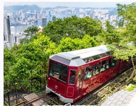
รถรางพิกแคม