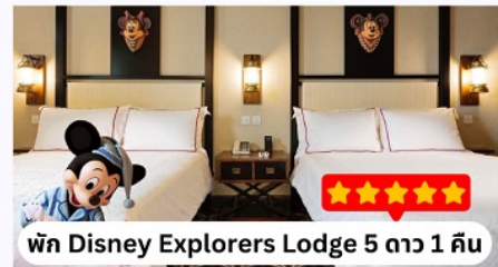
พัก Disney Explorers Lodge 5 ดาว 1 คืน