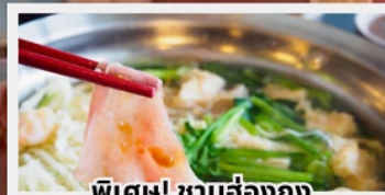
พิเศษ! ชาบูฮ่องกง